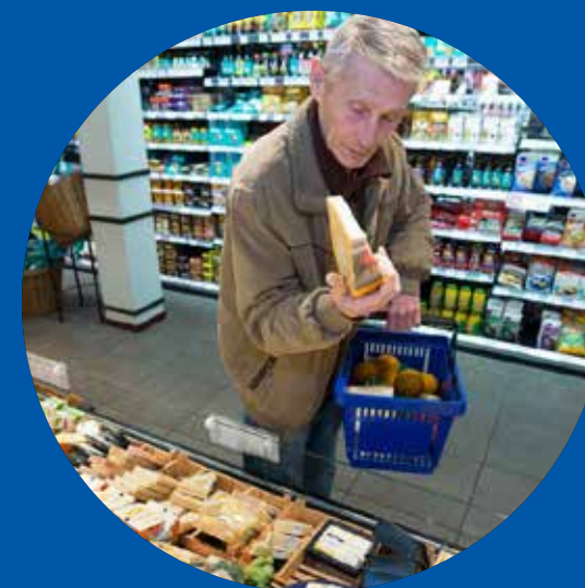
Dementiezorg voor Elkaar